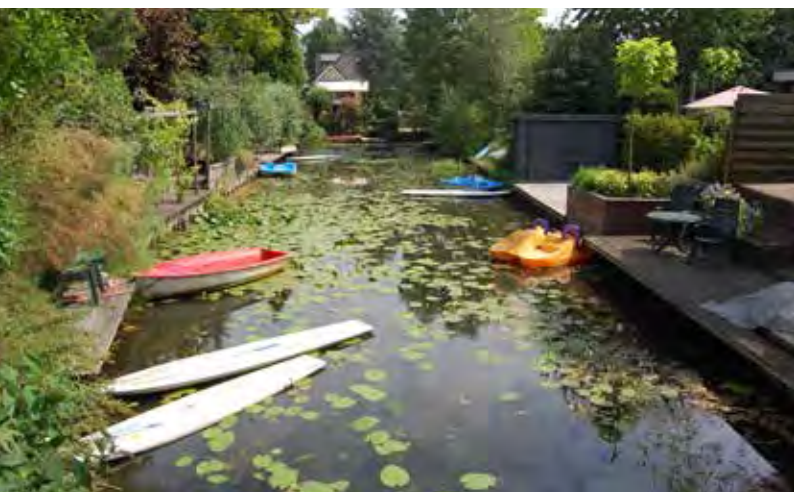
Asterdplas; woonwijk aan het water, natuur en recreatiegebied.