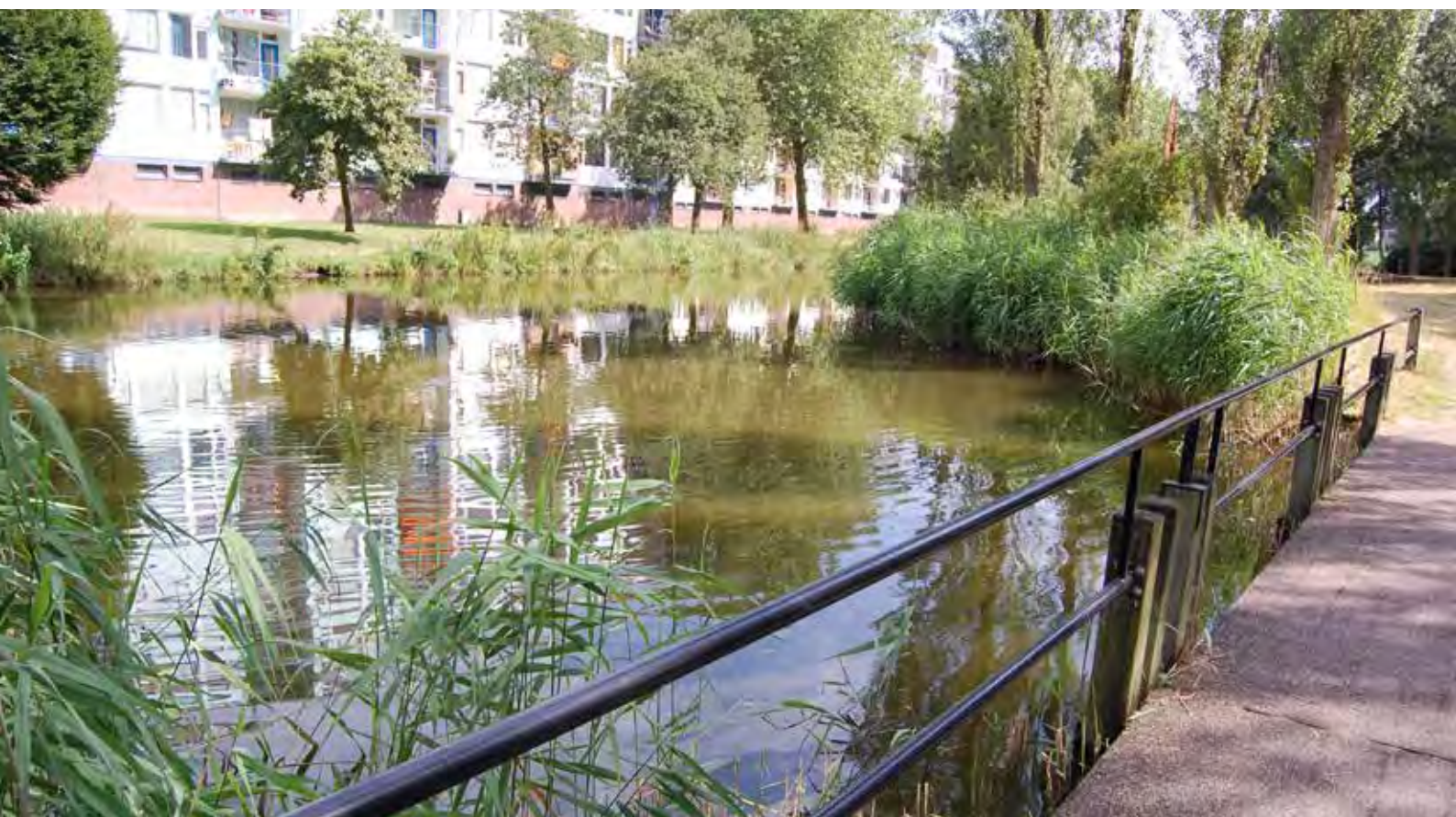
Hoge Vucht; jaren 60 woonwijk aan de gemeenterand, vergroend en parkachtig.